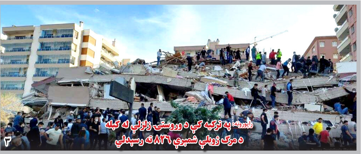
راپورونه: په ترکیه کې د وروستی زلزلې له کبله د مرګ ژوبلې شمېرې ۸۲۶ ته رسېدلې