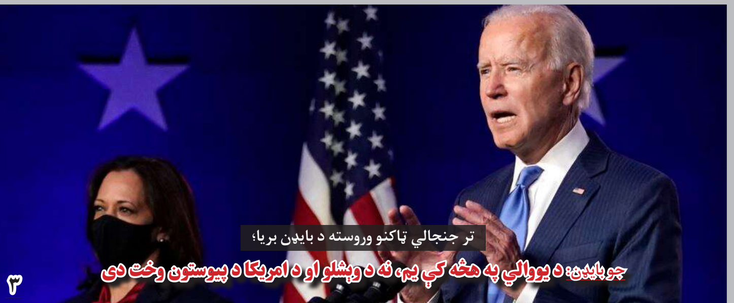
تر جنجالي ټاکنو وروسته د بایډن بریا؛ جو بایډن: د یووالي په هڅه کې یې، نه د وپشلو او د امریکا د پیوستون وخت دی

در عین حال رئیس مشرانو جرگه گفت که این جرگه، با در نظر داشت زمان تعیین شده (پانزده روز) در قانون اساسی، سند بودجه را بررسی و بعد از گنجائیدن نظریات شان تأیید خواهد کرد.