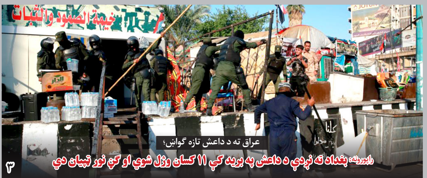
راپورونه: بغداد ته نړدې د داعش په برید کې ۱۱ کسان وژل شوي او گڼ نور تپیان دي