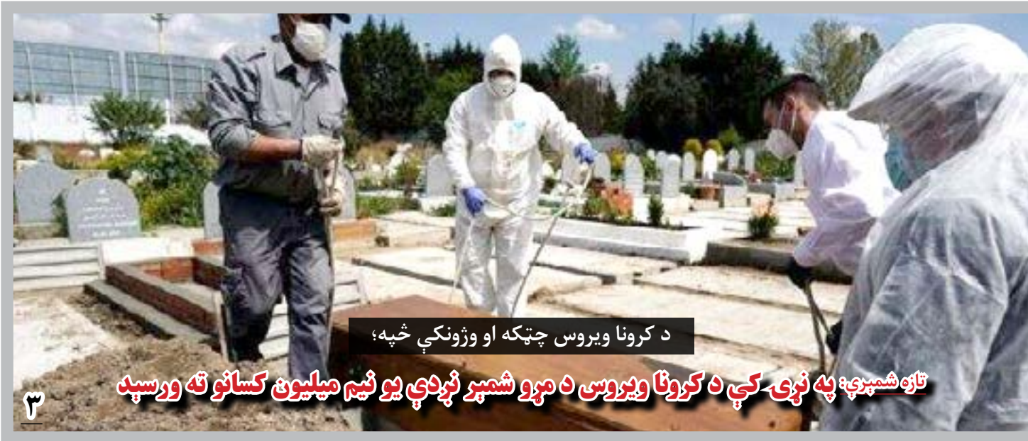
د کرونا ویروس چټکه او وژونکې خپه؛

منبع افزوده است که با حمایت واضح کشورهای عضو از مذاکرات صلح، این قطعنامه ها با صراحت تمام از آغاز مذاکرات صلح استقبال نموده و از اقدامات دولت افغانستان در زمینه افاده ژست های سازنده به خصوص رهایی زندانیان طالبان، قدردانی نمودند.