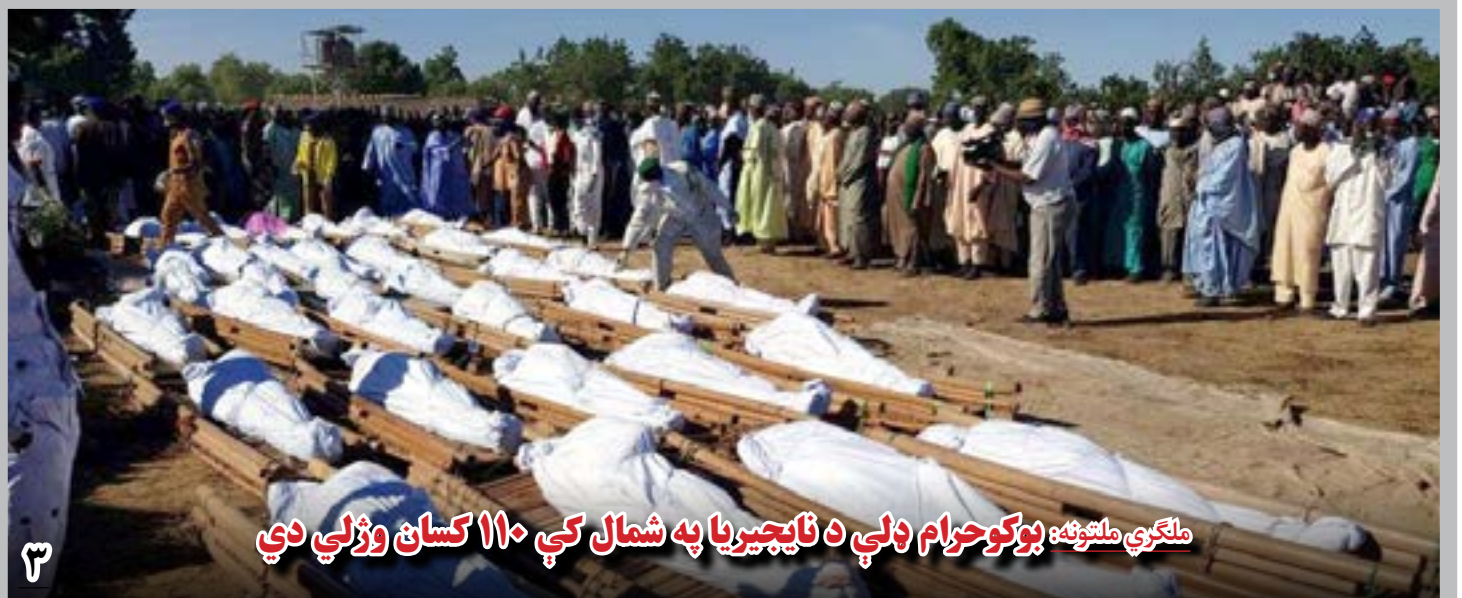
ملگري ملتونه: بوکو حرام ولې د نایجیریا په شمال کې ۱۱۰ کسان وژلي دي

داکتر تینا گفت زمانیکه در روند کمک های آنان، از موجودیت فساد بحث میشود، آنها به زودی اقدام می نمایند و در خصوص آن تحقیقات جدی می کنند.