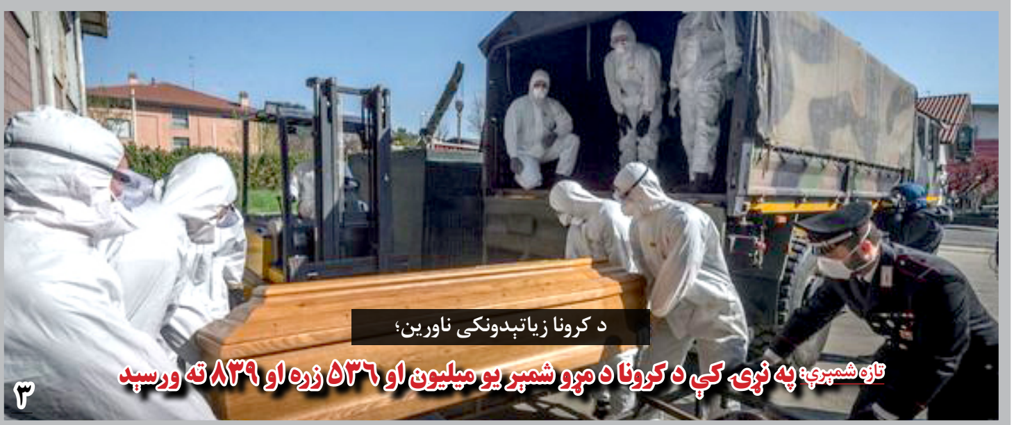
د کرونا زیاتېدونکی ناورین؛

تازه شمېرې: په نړۍ کې د کرونا د مړو شمېر یو میلیون او ۵۳۶ زره او ۸۳۹ ته ورسېد