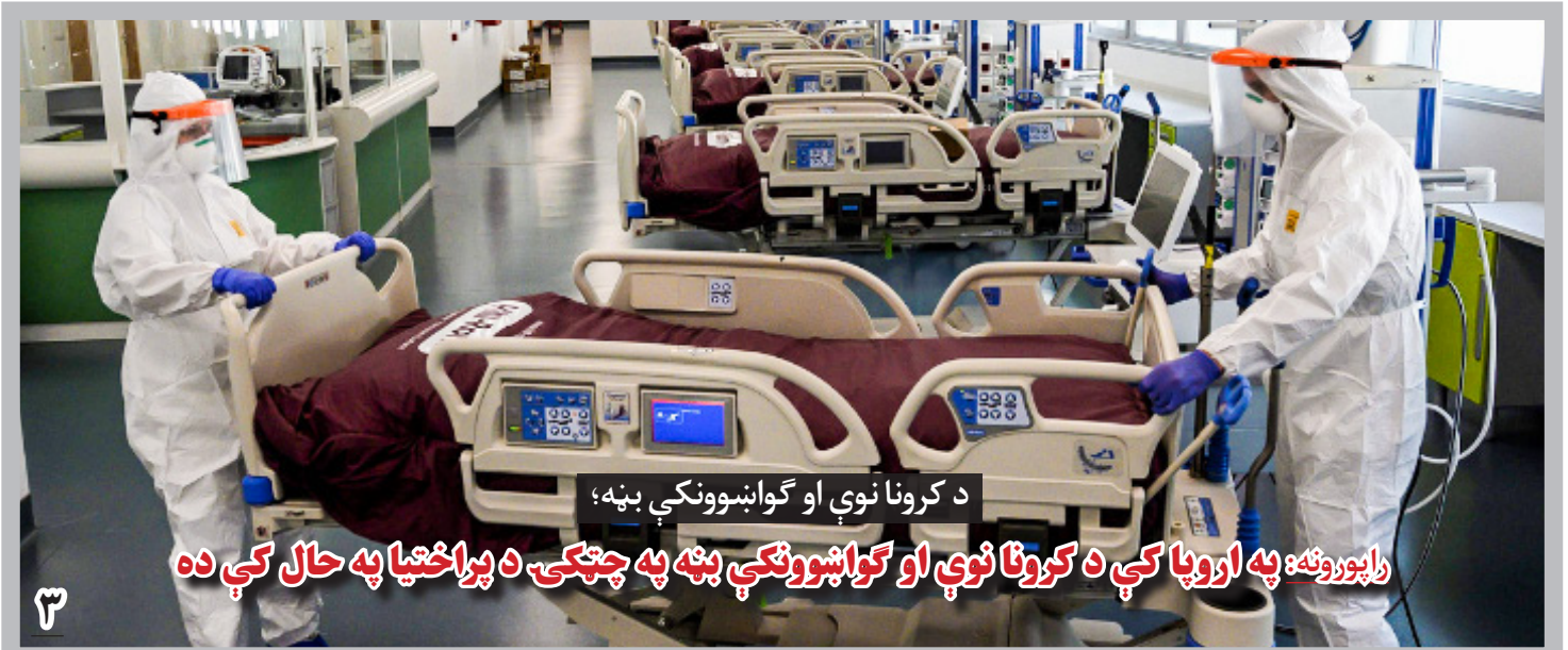
د کرونا نوي او گوانسبونکې بڼه؛ راپورونه: په اروپا کې د کرونا نوي او گوانسبونکې بڼه په چټکۍ د پراختيا په حال کې ده