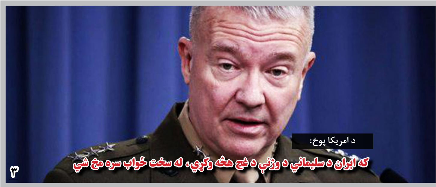
د امریکا پوځ:

این خبرنگار، آماج قرار گرفتن خبرنگاران رادر هفته های اخیر در کشور، نگران کننده گفته اند. هفته گذشته، دوبرا لاینز، نماینده ویژه سازمان ملل در افغانستان گفت که تنها در سال روان میلادی، شش خبرنگار و ده تن از مدافعان حقوق بشر در افغانستان جان های شان را از دست داده اند. او بر بررسی این رویدادها از سوی حکومت افغانستان، تأکید کرد. اما به گفته خبرنگاران و نهاد های مدافع خبرنگاران می گوید که حکومت تا اکنون در این عرصه دست آورد خاصی ندارد.