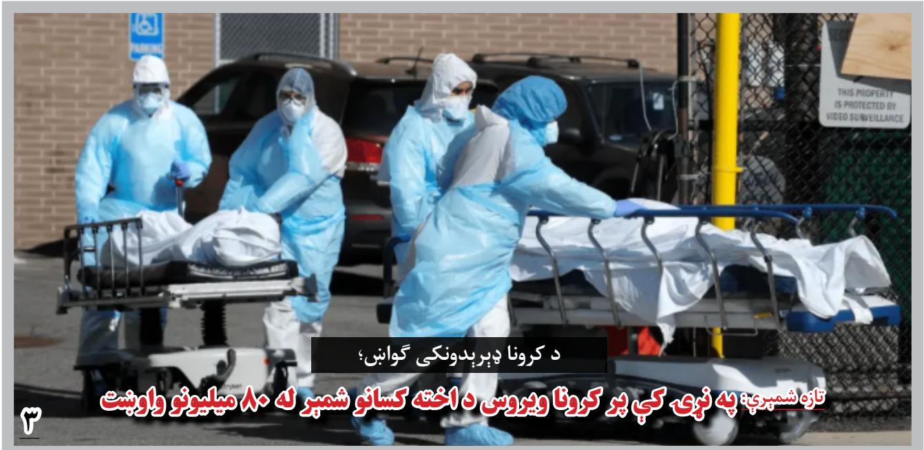
د کرونا ډېر بدنګي ګواښ؛ تازه شمېرې په نړۍ کې پر کرونا ویروس د اخته کسانو شمېر له ۸۰ میلیونو واوښت

سیمین بارکزی، عضو ولسی جرگه اظهار داشت: «دوگانگی داخل پارلمان باعث شده‌است که کسی در این باره صحبت هم نکند. یک عده به نوعی حکومتی هستند، یک عده از قانون دفاع می‌کنند.»