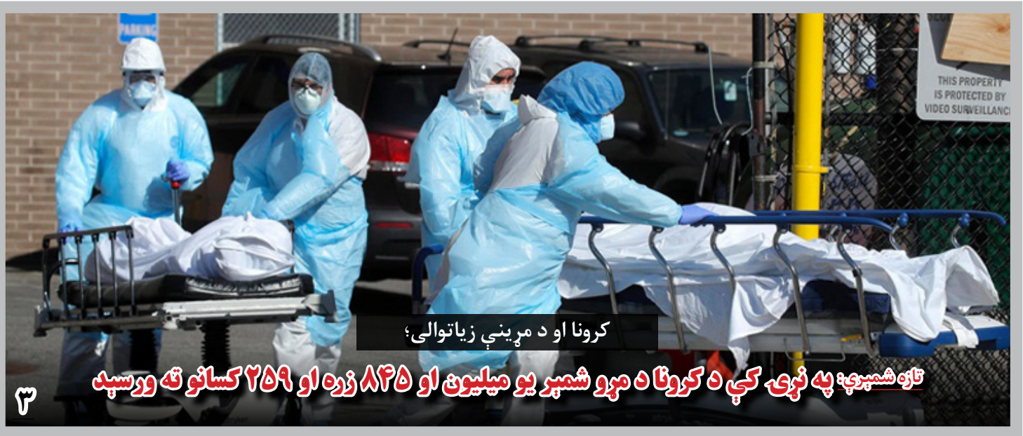
کرونا او د مړینې زیاتوالی؛

همچنان وزارت صحت گفته است که در ۲۴ ساعت گذشته، ۸ تن به اثر ابتلا به (کوید-۱۹) فوت کرده و از آغاز شیوع ویروس کرونا تا کنون در افغانستان، شمار مجموعی جان باختگان از اثر این بیماری، به ۲۲۳۰ نفر رسیده است.