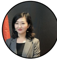
ليکنه: ډېوه د چين ميډيا گروپ د پښتو څانگې خبرياله