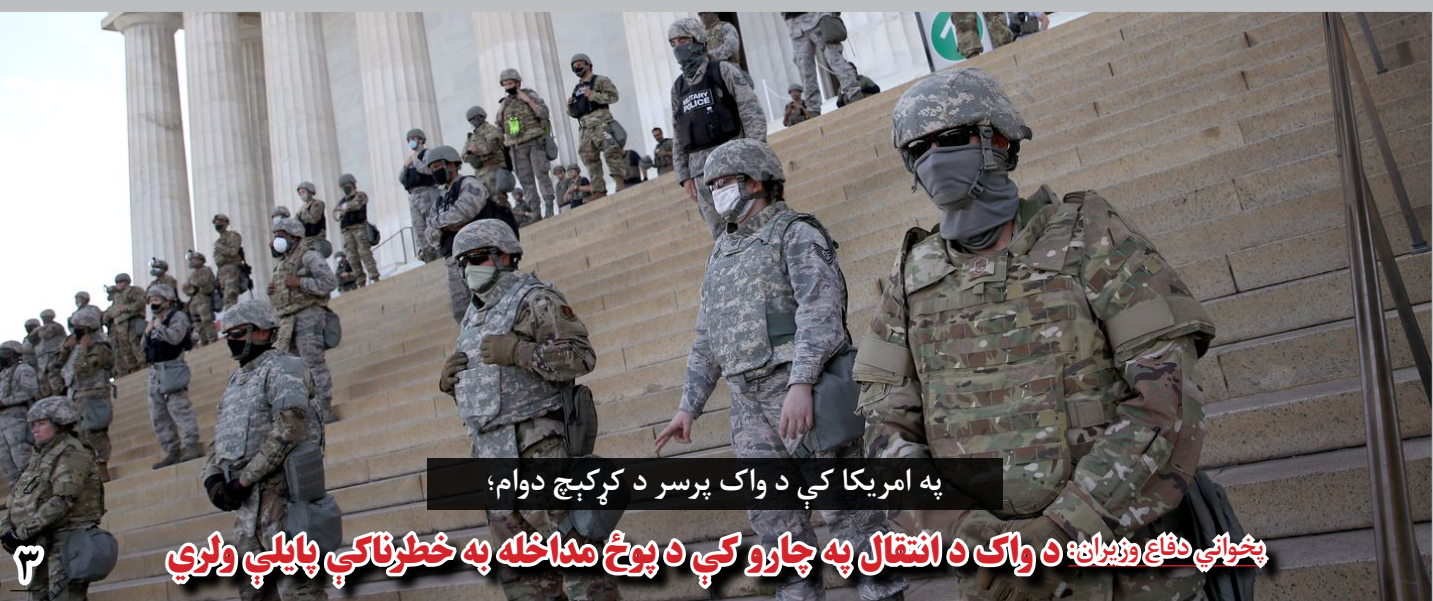
په امریکا کې د واک پرسر د کرکېچ دوام؛