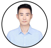
لیکنه: شي مونگ

ژباړه: زرينه - د چين ميډيا گروپ د پښتو خانگي خبرياله