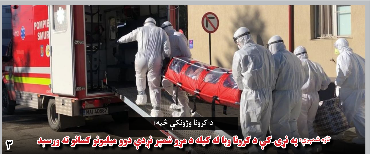
د کرونا وژونکې خپه؛