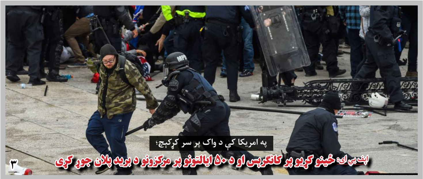
په امریکا کې د واک پر سر کړکېچ: اېف پی ای: ځینو کړیو پر کانګرېس او د ۵۰ ایالتونو پر مرکزونو د برید پلان جوړ کړی

قریشی افزوده است که پاکستان، به نقش مثبت خود در برابر کردن سهولت ها برای صلح افغانستان ادامه خواهد داد.