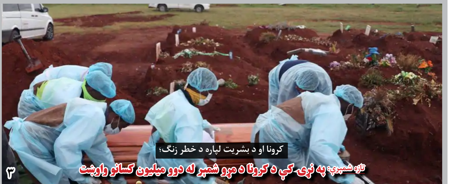
کرونا او د بشریت لپاره د خطر زنگ؛

شماری از این خبرنگاران در کابل با انتقاد از رویکرد حکومت در برابر رسانه ها می گویند که حکومت برای حفظ آزادی بیان و تأمین امنیت خبرنگاران هیچ اراده بی ندارد.