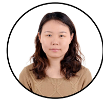
ليکنه: سپورمۍ د چين ميديا گروپ د پښتو خانگي خبرياله