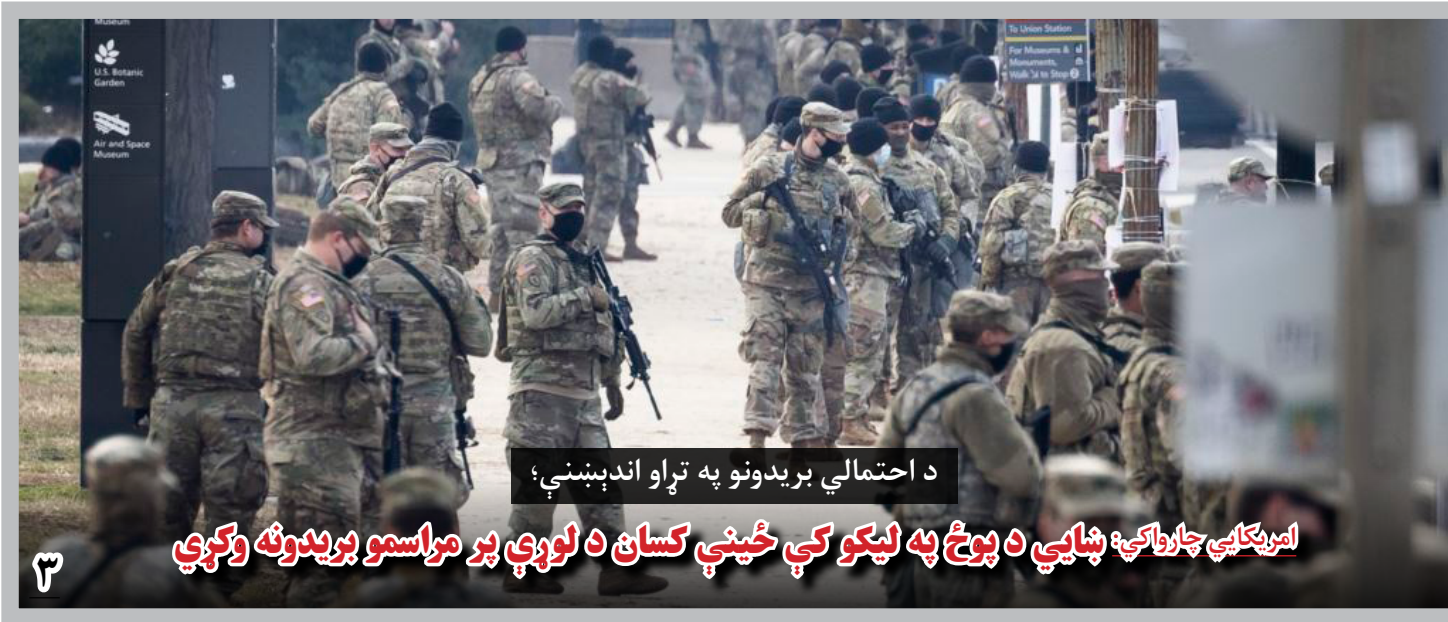
امریکایی چارواکی: بنای د پوځ په لیکو کې ځینې کسان د لوړې پر مراسمو بریدونه وکړي

سفارت امریکا در کابل می گوید که اخیراً حملات، رویدادهای جنایی و قتل های هدفمند در افغانستان افزایش یافته است؛ بنابر این شهروندان این کشور، باید از آمدن به افغانستان خودداری کنند. در خبرنامه ای که از سوی سفارت امریکا در کابل، به نشر رسیده، آمده است که تعدادی هتل ها، اقامتگاه ها، دفتر ملل متحد در کابل و سایر مناطقی که اتباع خارجی، به ویژه اتباع امریکایی در آنجا رفت و آمد دارند، با تهدیدهای بیشتری رو به رو می باشد. بر اساس خبرنامه، سفارت امریکا در کابل به همه شهروندان امریکایی هشدار داده است که از سفر کردن به افغانستان خودداری نمایند و کسانی که در افغانستان مستقر هستند، این کشور را ترک کنند. در خبرنامه، بر اتباع امریکایی تاکید شده است که اگر در افغانستان می مانند، فقط سفرهایی را انجام دهند که بسیار ضروری باشد. این درحالی است که سه ماه پیش نیز سفارت امریکا در خبرنامه ای گفته بود که قتل های خبرنگاران و فعالان مدنی در کابل، و ولایت های دیگر افزایش خواهد یافت. سفارت امریکا، در حالی این اظهارات را بیان می کند که تعداد قتل های هدفمند، حوادث جنایی و سایر جرم ها، از هر زمان دیگر در کابل به بالاترین حد خود رسیده است.