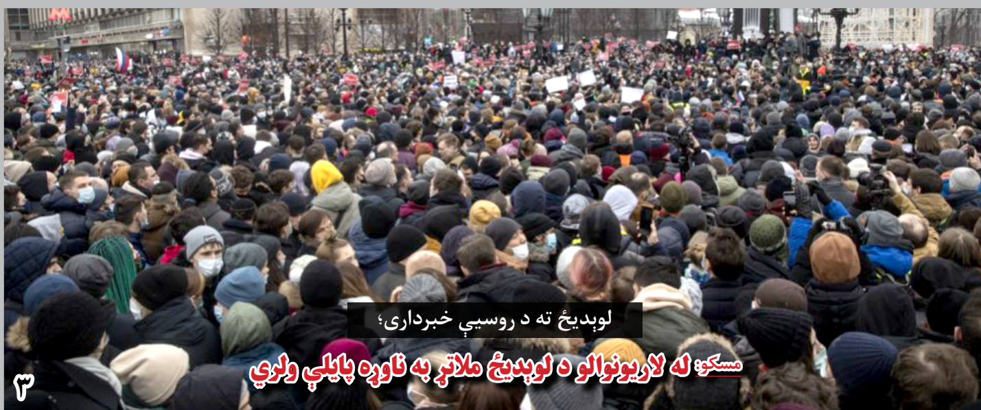
لویدیخ ته د روسیې خبرداری؛

این جرگه به میان آوردن تعادل در معاشات مامورین و معلمین را خط سرخ خود خوانده، هشدار داده است تا زمانی که حکومت به خواست های نماینده گان مردم تمکین نکند، طرح بودجه را تصویب نمی کند. در نشست دبروز ولسی جرگه نیز روی مشکلات در سند بودجه و اقدامات حکومت به دنبال رد طرح بودجه بحث شد. شماری از اعضای این جرگه گفتند که حکومت اقارب و نزدیکان آن عده از اعضای جرگه را که در روز رای دهی به مظنون رد بودجه کارت سرخ بلند کرده بودند، برکنار کرده است.