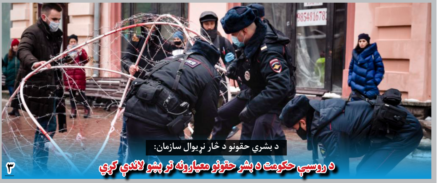
د بشري حقونو د څار نړيوال سازمان: د روسیې حکومت د بشر حقونو معیارونه تر پښو لاندې کړي