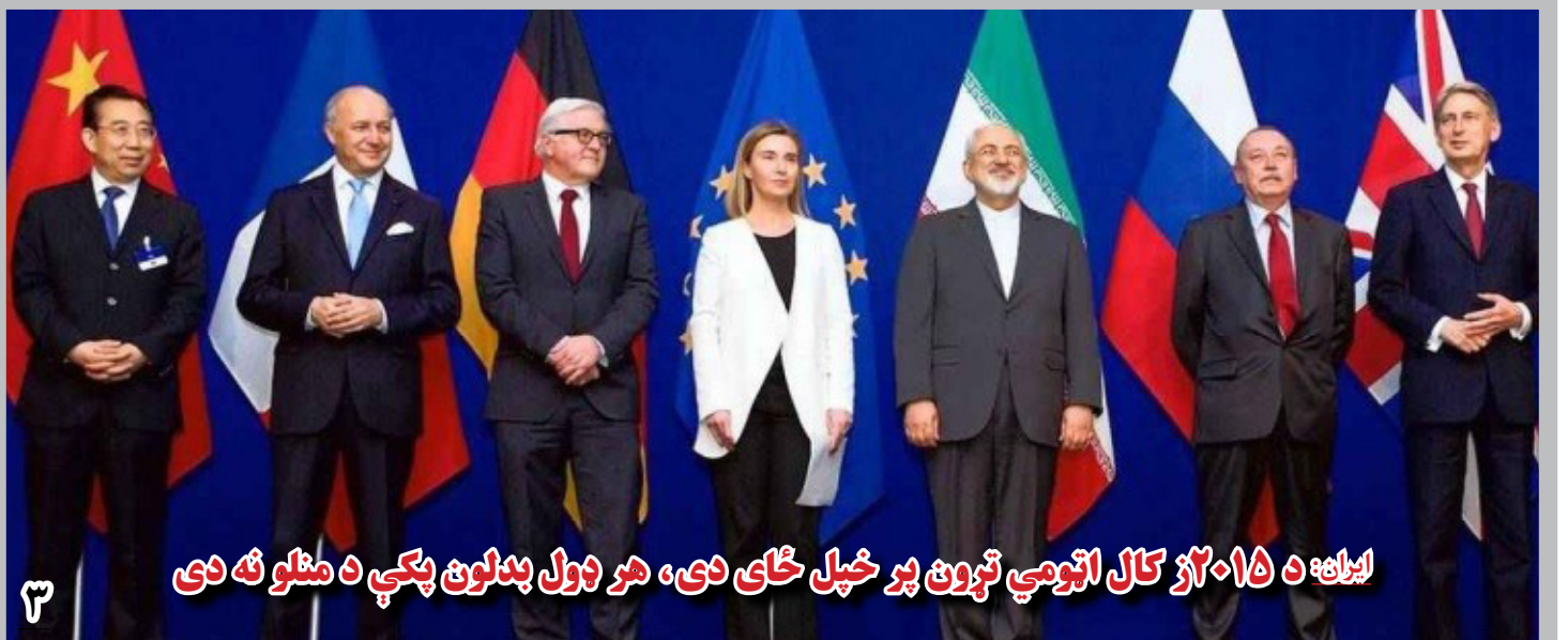
۱۷:۰۵ د ۲۰۱۵ز کال اتومي تړون پر خپل ځای دی، هر ډول بدلون پکې د منلو نه دی

محمد جواد ظریف وزیر امور خارجه ایران، در این دیدار با اشاره به اقدامات آمریکا در افغانستان تاکید کرد و گفت که آمریکا میانجی و حکم خوبی نیست. موصوف اظهارداشت: «ما از یک دولت فراگیر اسلامی با حضور همه قومیت‌ها و مذاهب، حمایت می‌کنیم و آن را ضرورتی برای افغانستان می‌دانیم.» وی گفت مردم افغانستان، از شما هستند و نباید در عملیات‌ها هدف قرار گیرند. قبل ازین، ملا برادر با علی شمخانی رئیس شورای امنیت ملی ایران نیز دیدار نموده بود.