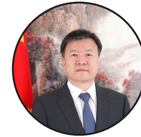
لیکنه: وانگ یو په افغانستان کې د چین لوی سفیر