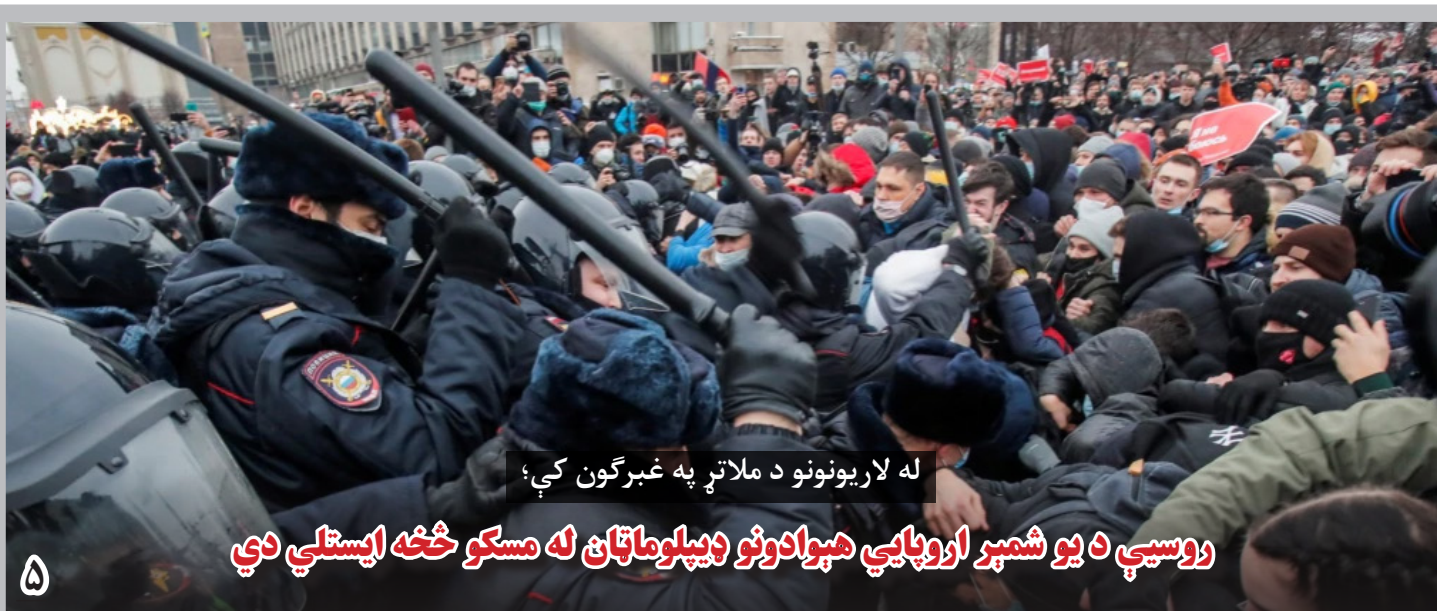
له لاریونونو د ملاتړ په غبرگون کې؛ روسیې د یو شمېر اروپایي هېوادونو دیپلوماتان له مسکو څخه ایستلي دي

جنرال دنفورد چگونه‌گی پیشرفت را در روند صلح نیز از زاویه دیگری می‌بیند: «ما حقایقی داریم. طرف‌ها در دوحه با هم دیدار می‌کنند و این یک کار مثبت است؛ اما پس از فبروری ۲۰۲۰، پیشرفتی را که فکر می‌کنیم برای تکمیل شدن توافق نیاز است، نداریم.» در همین حال، جنرال دنفورد تأکید می‌ورزد که تصمیم‌گیری درباره آینده افغانستان از آن خود افغانان است: «ما می‌خواهیم به افغانان این فرصت را بدهیم که خودشان درباره آینده شان، آینده‌یی که از بسیاری از افغانان درباره‌اش شنیده‌ایم، تصمیم بگیرند. این آینده باید با ارزش‌های کنونی قانون اساسی و با پیشرفت‌های دو دهه گذشته افغانان سازگار باشد.»