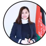
لیکنه: زربینه د چین میډیا گروپ د پښتو څانګې خبریاله

هغوی چې د سولې په پروسه کې یې خنډونه جوړ کړل، د بهرنیو ځواکونو د پاتې کېدو لپاره یې هڅې وکړې او وبې نه غوښتل چې بین الافغاني خبرې بریالی شي، د دې راتلونکې جگړې مسوولیت یې پر غاړه دی. د دې تر څنګ د بهرنیو ځواکونو پاتې کېدل به بیا هم د جگړې اصلي لامل وي او هر افغان باید پر دې تمرکز وکړي چې هېواد له بهرنیو ځواکونو پاک کړي او د جگړې اصلي لامل ختم کړي. له بله اړخه تر هغو چې موږ افغانان خپلې ستونزې خپله حل نه کړو، همداسې به هم په جگړه کې وو او هم به بهرني ځواکونه دلته حضور ولري.