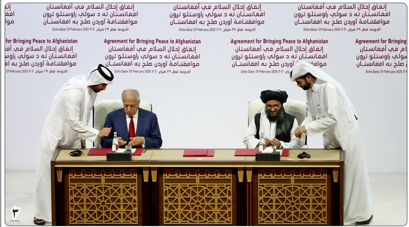
اتفاق إحلال السلام في أفغانستان افغانستان ته د سولې راوستلو تړون موافقتنامه آوردن صلح به افغانستان دوحه، قطر ۲۹ فبرار ۲۰۲۰ ۲۰۲۰ for Bringing Peace to Afghanistan Agreement for Bringing Peace to Afghanistan افغانستان ته د سولې راوستلو تړون موافقتنامه آوردن صلح به افغانستان دوحه، قطر ۲۹ فبرار ۲۰۲۰ ۲۰۲۰ اتفاق إحلال السلام في أفغانستان افغانستان ته د سولې راوستلو تړون موافقتنامه آوردن صلح به افغانستان دوحه، قطر ۲۹ فبرار ۲۰۲۰ ۲۰۲۰ ام فی أفغانستان سولې راوستلو تړون صلح به افغانستان دوحه، قطر ۲۹ فبرار ۲۰۲۰ ۲۰۲۰

د چین د دوو مجلسونو د ۲۰۲۱ کال کلنۍ غونډې به ژر پرانیستل مخ ۳