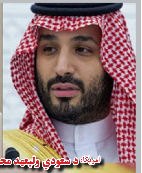
د واشنگتن او ریاض ناندی؛