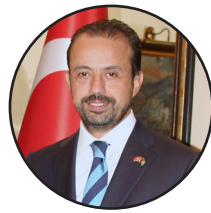
ليکنه: اوغوزخان ارطغرل په افغانستان کې د ترکيې لوی سفير

که د دوحې هوکړې پوره عملي کېږي او که نيمه، خو بين الافغاني خبرې بايد جدي شي او پایله ولري. د سولې روانه پروسه بايد د افغان وژنې دا ماشين ودروي. همدا د هر افغان غوښتنه ده او ټول افغاني اړخونه هم بايد په همدې چاره تمرکز وکړي. له دې پرته به ښايي مختلف لوري گټې وکړي، خو ولس بيا هم بيلونکی دی.