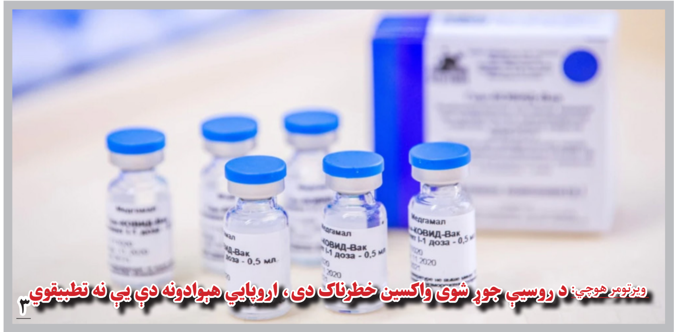
ویژنومر هوچی: د روسیې جوړ شوی واکسین خطرناک دی، اروپایي هېوادونه دې یې نه تطبیقوي

وزیر خارجه نیز می‌گوید که در دیپلماسی‌های اقتصادی، انرژی، تجارت و سرمایه‌گذاری و دیپلماسی جلب کمک‌های خارجی برای افغانستان، دستاوردهای قابل ملاحظه‌یی داشته است.