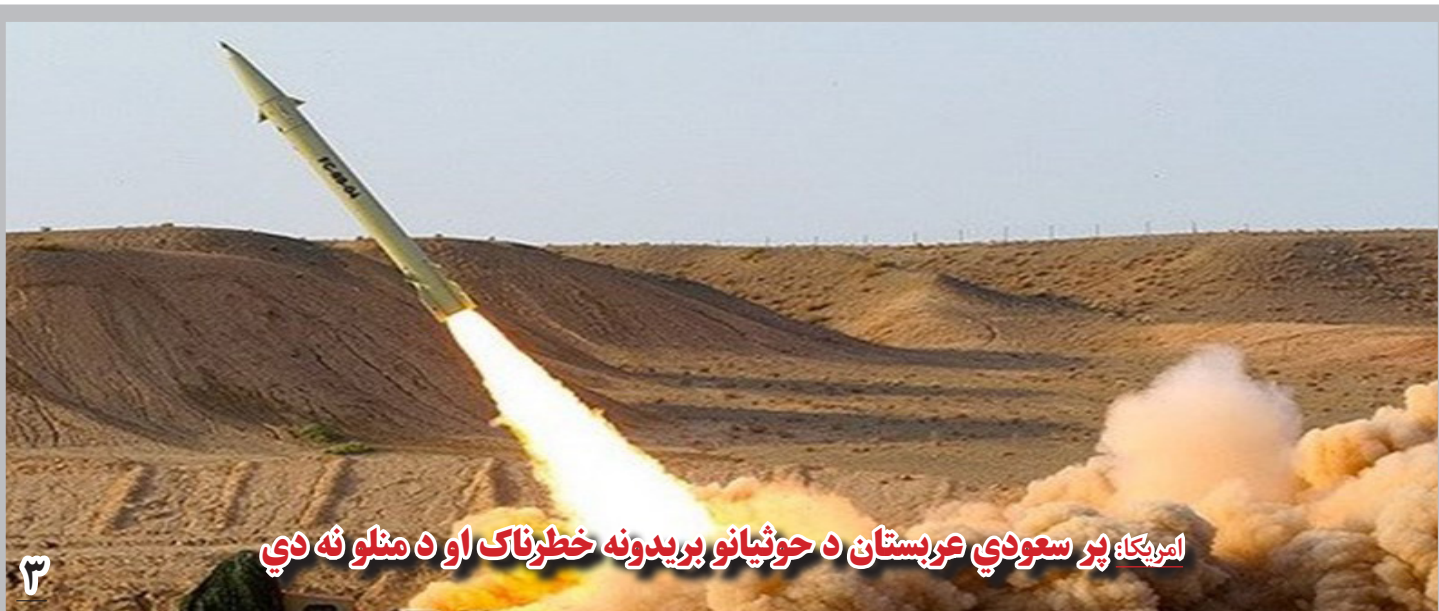
امریکا: پر سعودی عربستان د حوثیانو بریدونه خطرناک او د منلو نه دي

هم زمان با این اعتراض، شمار دیگری از باشندگان غور در چند قدمی این اعتراض به پشتی بانی از نورمحمد کوهنورد چادر تحصن برپا و در تجمع امروز شان به برجاماندن والی این ولایت تأکید کردند. آنان والی غور را شخص توانا و کارکن عنوان می کنند. با این حال، نورمحمد کوهنورد، والی غور، اعتراض باشندگان این ولایت را حق مدنی شان می داند اما می گوید، معرضانی که بر ضد او شعار می دهند، کسانی اند که مخالف عملیات نیروهای امنیتی اند و بیش تر اختلافات قومی را دامن می زنند.