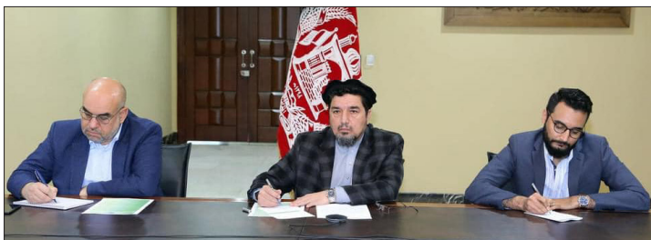
ښه استفاده وکړو.

دا په داسې حال کې ده چې روسیه په پام کې لري چې د روانې اونۍ د پنجشنبې په ورځ د افغانستان د سولې په اړه په مسکو کې د یوې غونډې کوربه توب وکړي.