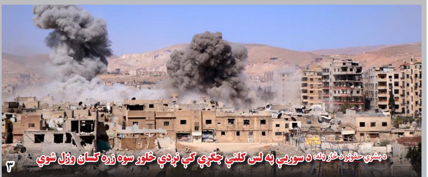
دبشري حقونو د څاروله: د سوريې په لس کلني جگړې کې نږدې څلور سوه زره کسان وژل شوي

اما وزارت امور داخله راه‌اندازی بیش از سه هزار و هفت صد عملیات، بازداشت بیش از چهارهزار و سه صد مظنون به قاچاق مواد مخدر و تخریب ده‌ها ذخیره گاه مواد مخدر را در یک سال گذشته از دست آورده‌های خوب این وزارت می‌گوید.