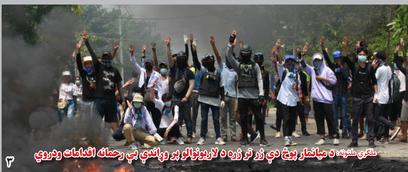
ملکري ملتونه: د میافمار پوځ دې ژر تر ژره د لاریونوالو پر وړاندې بې رحمانه اقدامات ودروي

بر اساس یافته‌های این تحقیق، از میان یک‌هزار و ۵۰۴ تن از مصاحبه‌شونده‌گان، یک‌هزار و ۴۲ تن (۶۹.۳ درصد) دارای معلولیت فیزیکی از نوع نقص عضو، ۲۹۴ تن (۱۹.۵ درصد) معلولیت حسی فیزیکی، ۴۲ تن (۲.۸ درصد) دارای معلولیت بیولوژیکی و متابولیکی مانند بیماری‌ها یا عارضه‌های دیابت، فشارخون، صرع، مهرگی و اوتیسم و ۶۸ تن (۴.۵ درصد) معلولیت ذهنی و روانی بوده‌اند. هم‌چنان ۵۸ تن (۳.۹ درصد) دیگر نیز دارای معلولیت مضاعف بوده؛ به این معنا که دو یا بیش از دو نوع معلولیت داشته‌اند.