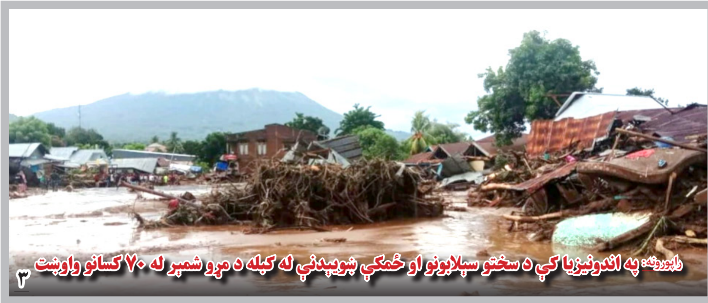
راپورونه: په اندونیزیا کې د سختو سیلابونو او ځمکې ټوپیدنې له کبله د مړو شمېر له ۷۰ کسانو واوښت

طبق خبرنامه نی، این نهاد پیش از این بارها نگرانی خود در پیوند به قتل‌های هدفمند خبرنگاران و فعالان رسانه‌یی را مطرح کرده بود و اعلامیه دیدبان حقوق بشر تأییدی بر نگرانی‌های نی و جامعه رسانه‌یی کشور است. نهاد پشتیبان رسانه‌های آزاد افغانستان قتل خبرنگاران، فعالان رسانه‌یی و اعضای خانواده‌های‌شان را خلاف قوانین ملی و اصول بین‌المللی خوانده و تأکید کرده است که قتل خبرنگاران و فعالان رسانه‌یی به‌عنوان گروه‌های غیرنظامی خلاف قواعد حقوقی جنگ در کنوانسیون چهارگانه ژنو است و جنایت جنگی و ضد بشری تلقی می‌شود.