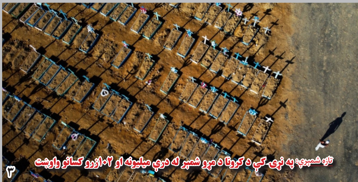
تازه شمېرې: په نړۍ کې د کرونا د مړو شمېر له درې ميليونه او ۲۰۲ ازرو کسانو وروست