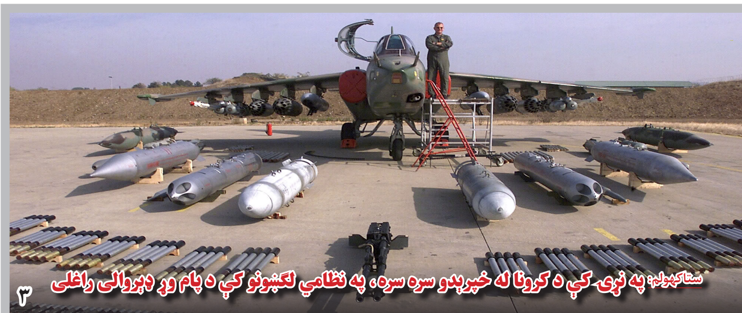
ستاکیولم: په نړۍ کې د کرونا له خپرېدو سره سره، په نظامي لګښتونو کې د پام وړ وپېرولې راغلي

منبع گفته است که این قرارداد برای مدت یک سال صورت گرفته بود؛ اما به تقاضای این افراد و تایید استخراج تصدی معدن تا سال ۱۳۹۳ ادامه یافت؛ اما بر اساس معلومات حاصله، پس از این مدت، معدن ذکرشده از سوی افراد مسلح غیرمسئول و مسئولان فابریکه جات گچ به شکل غیرقانونی استخراج می شود. بر اساس معلومات به دست آمده، ریاست معدن و پترولیم در تاریخ ۱۹ ماه حمل سال ۱۳۹۵، در یک مکتوب به مقام ولایت بغلان نگاهشته است که فابریکه جات گچ در معدن شیخ جلال در ولسوالی مرکزی بغلان، به شکل غیر قانونی استخراج می شود.