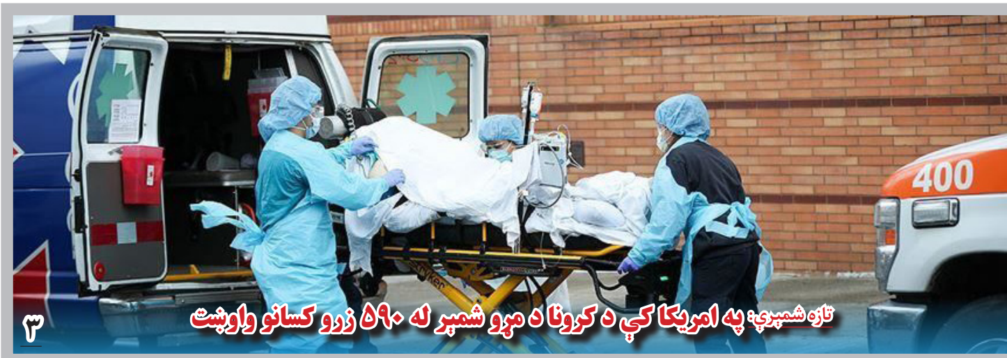
تازه شمېرې: په امریکا کې د کرونا د مړو شمېر له ۵۹۰ زرو کسانو واوښت