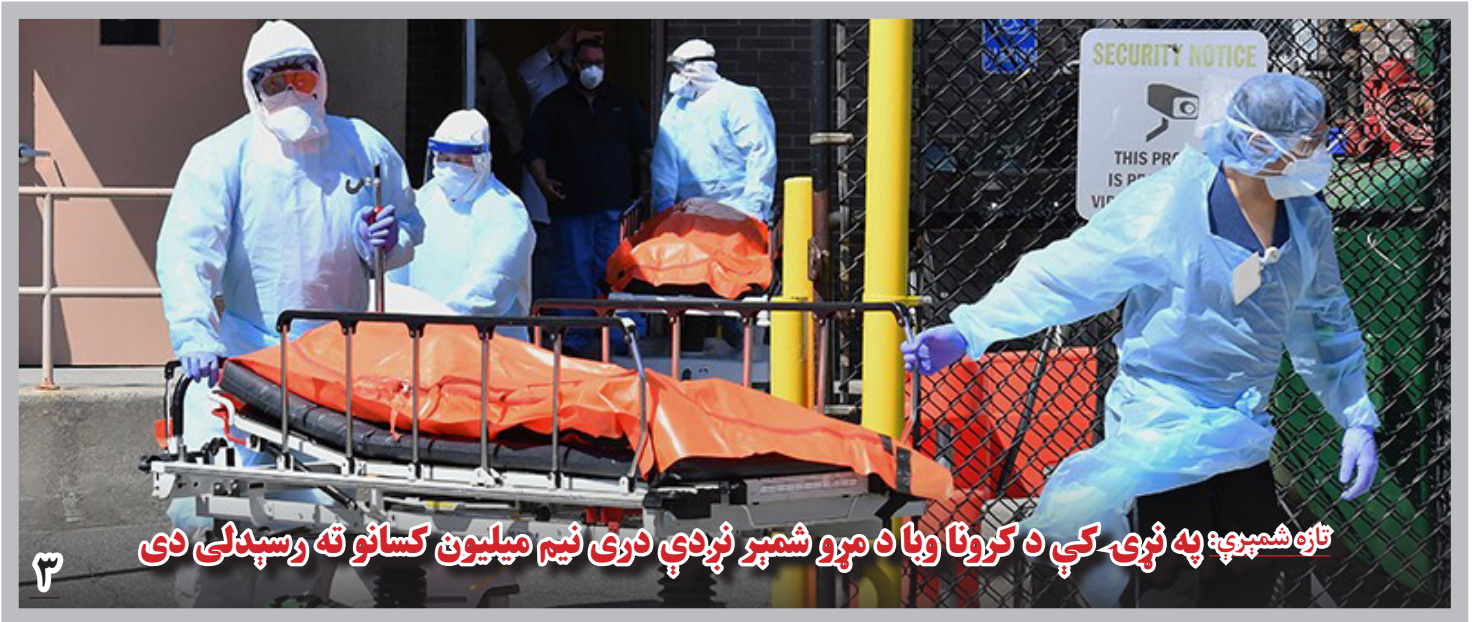
تازه شمیری: په نړۍ کې د کرونا وبا د مړو شمیر نږدې درې نیم میلیون کسانو ته رسېدلی دی

در حالی که پیش از این، اختلاف دیدگاه ها میان حکومت و سیاست گران درباره چه گونه گی صلاحیت های شورای عالی دولت وجود داشت، اما آقای خپلواک تأکید کرد که شورای عالی دولت در مسایل حکومت داری و قانونی، کاری ندارد و به مسایل صلح و جنگ و روابط افغانستان با کشورها خواهد پرداخت.