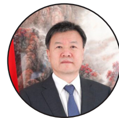
وانگ يو په افغانستان کې د چین لوی سفیر