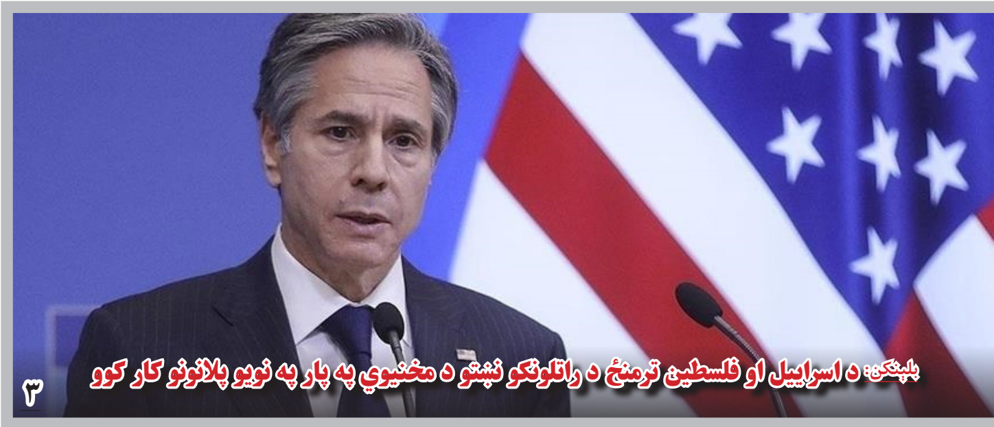
بلینکن: د اسرائیل او فلسطین ترمنځ د راتلونکو نېټو د مخنیوي په پار په نويو پلانونو کار کوو