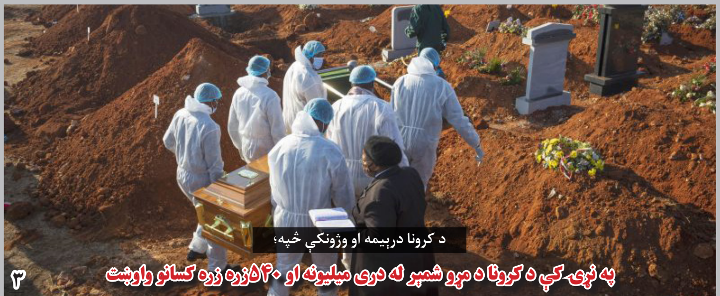
د کرونا در بیمه او و ژونگی خپه؛

در همین حال، جو بایدن رئیس‌جمهور ایالات متحده تاکید می‌ورزد که هرگاه شبکه القاعده باردیگر از افغانستان حمله‌ها را بر امریکا طرح ریزی کند، واشنگتن در برابر آن اقدام خواهد کرد.