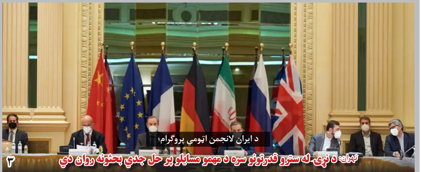
د ایران لانجمن ایتومی پروگرام؛ تهران: د نړۍ له سترو قدرتونو سره د مهمو مسایلو پر حل جدي بحثونه روان دي

با این آمارها، شمار مجموعی بیماران کووید زده در افغانستان به ۷۳ هزار و ۲۵۶ تن افزایش یافت. از این میان، ۲ هزار و ۹۷۴ بیمار جان باختند و ۵۷ هزار و ۶۳۰ بیمار هم بهبود یافته‌اند.