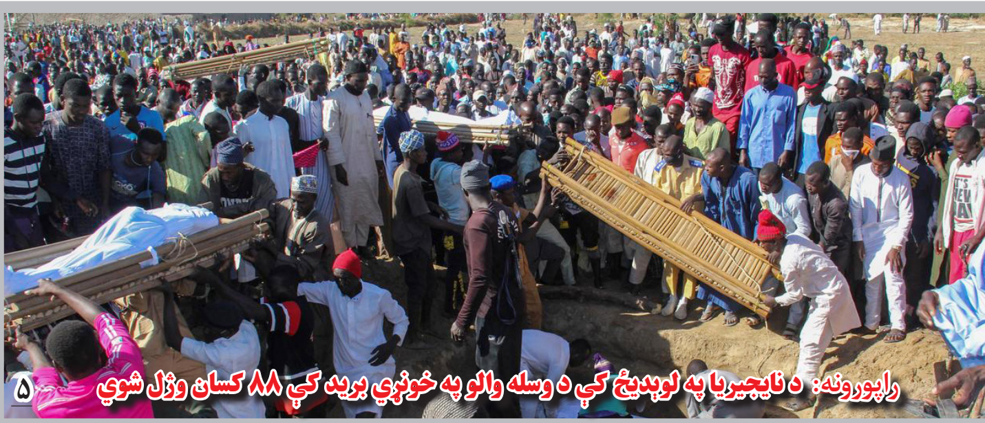
راپورونه: د نایجیریا په لویدیځ کې د وسله والو په خونړي برید کې ۸۸ کسان وژل شوي