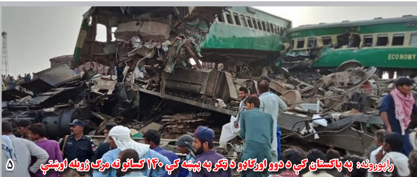
راپورونه: په پاکستان کې د دوو اورگاډو د ټکر په پېښه کې ۱۴۰ کسانو ته مرگ ژوبله اوښتې

په ياد هېواد کې را روان سپټمبر مياشت ټاکنې ترسره کېږي، چې په پايله کې به يې تر ۱۶ کلونو وروسته د اوسني لومړي وزيرې انگېلا مېرکل پر ځای بل څوک د نوموړې ځايناستي وټاکل شي.