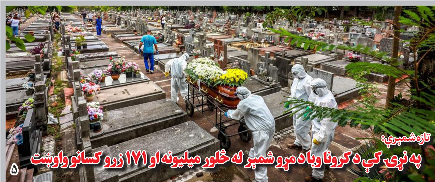
تازه شمېرې: په نړۍ کې د کرونا وبا د مرو شمېر له ۱۷۱ زرو کسانو واوښت