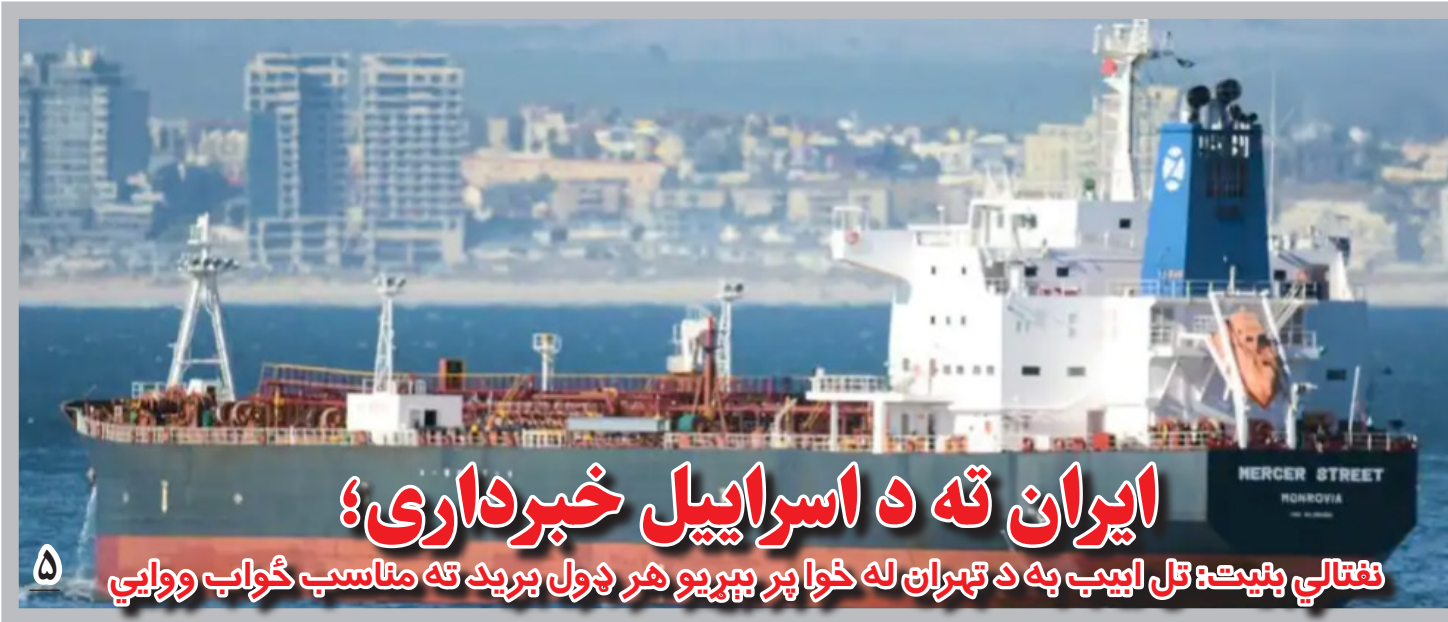
فتتالي بنیت: تل اییب به د تهران له خوا پر بېړیو هر ډول برید ته مناسب ځواب وویي

او می‌افزاید که طالبان به گروه‌های هراس افکن، اجازه ورود به کشور را داده‌اند. اما طالبان بارها ارتباط داشتن با گروه‌های هراس افکن بین‌المللی را، رد کرده‌اند. فوزیه کوفی، نماینده پیشین مردم ولایت بدخشان در ولسی جرگه و عضو هیئت مذاکره کننده جمهوری اسلامی افغانستان، ادعا کرد که جنگجویان خارجی در بخش‌های مرزی بدخشان با تاجیکستان حضور دارند و حتا خانواده‌های شان را نیز در این بخش‌ها انتقال داده‌اند. او هشدار داد که اگر حضور جنگجویان خارجی در بدخشان طولانی مدت شود، تهدیدها در کشور افزایش خواهند یافت: «حالا زمینه گشت‌وگذار و فعالیت جنگجویان خارجی از هر زمان ديگر، بیشتر شده؛ با توجه به این که به‌ویژه مناطق مرزی و مناطق استراتژیک... متأسفانه به تصرف طالبان درآمده.»